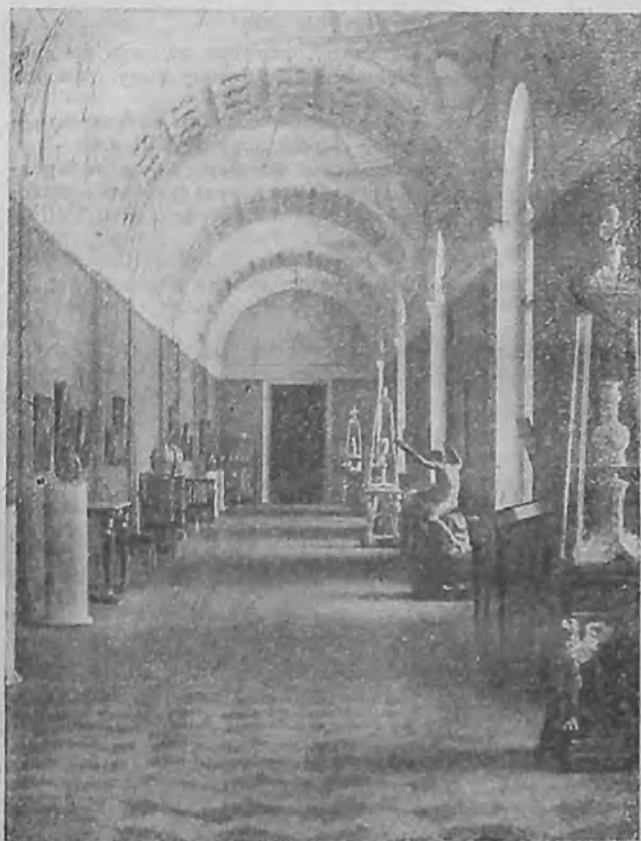
Общий вид зала 351