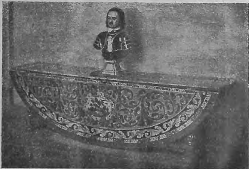
Б. Растрелли, Восковой бюст Петра I и стол фельдмаршала Б. П. Шереметьева (зал 358)