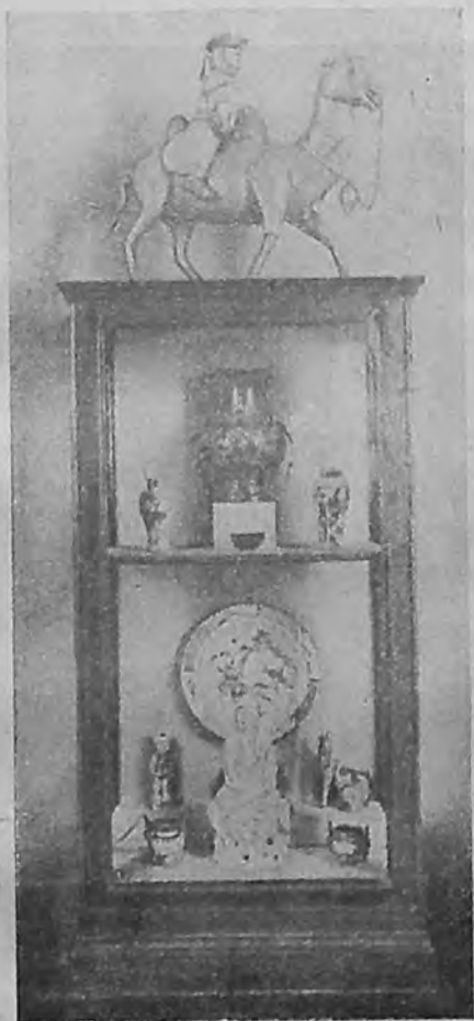
Памятники китайского искусства XVIII в. (Зал 358)