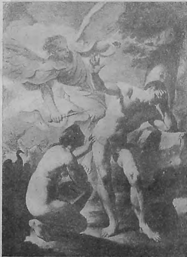
де-Феррари „Изгнание из рая“