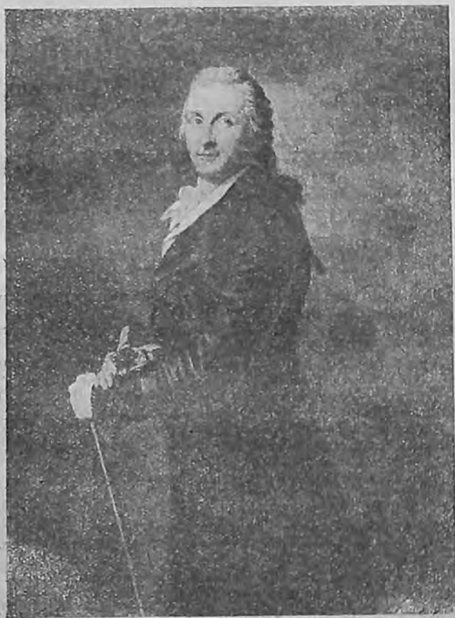
Антон Графф. Портрет ученого литератора Георга Леопольда