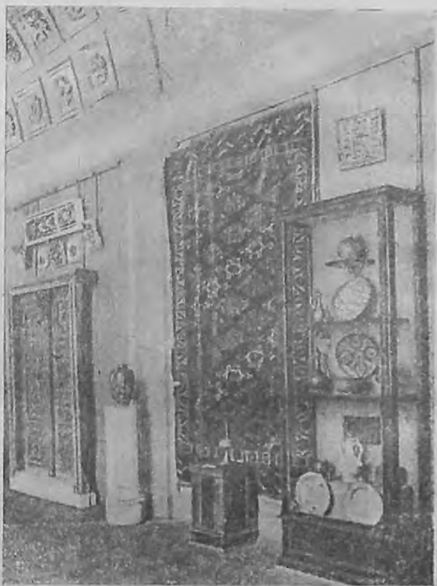
Пам'ят. ики культури и искусства Средной Азии (часть зала 358)