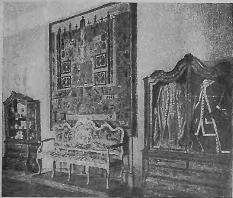
Памятники русской культуры и искусства XVIII в. (часть залы 358)