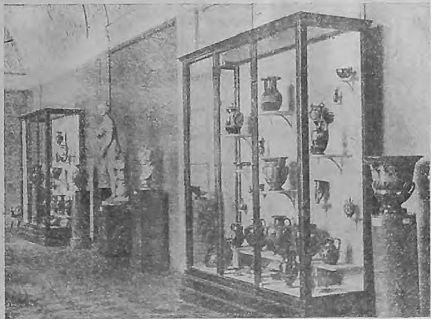
Раздел античного искусства. Грция VI—III вв. до х. э.