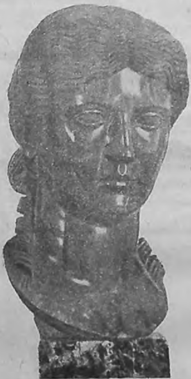
Портрет римлянки I в. до х э.